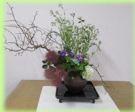
季節の花々でご利用者をお迎え