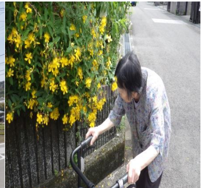
☆施設の周辺は、四季折々の花が楽しめます。☆