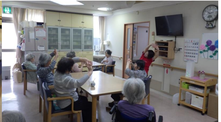
☆毎日、レクリエーションや体操しています。☆